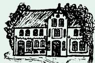
Alte Scheune Gut Hanerau