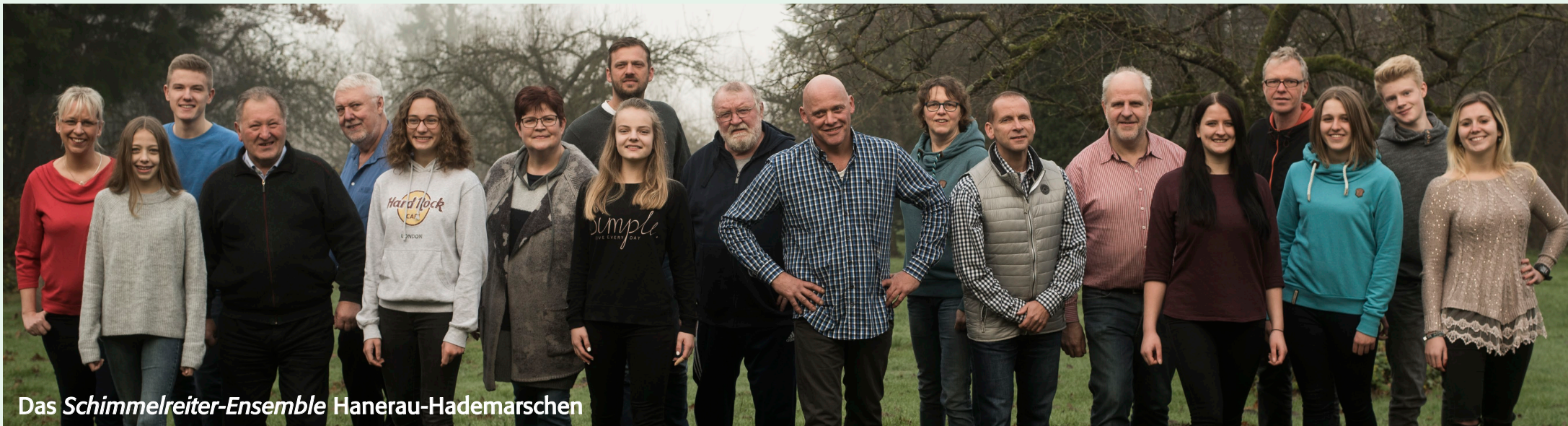
Das Schimmelreiter-Ensemble Hanerau-Hademarschen